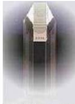
Circle of Excellence Award Winner 2004